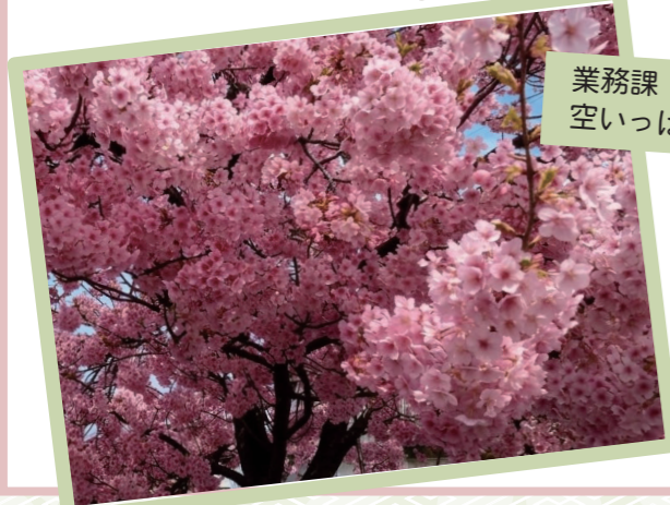
業務課 週末ガーデナー 空いっぱいの河津桜色