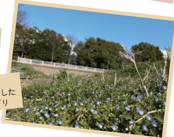
営業部 K 小さな春がきました オオイヌノフグリ