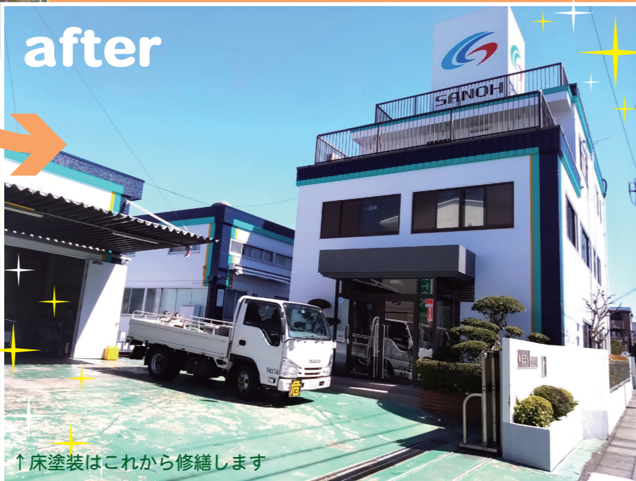
↑床塗装はこれから修繕します